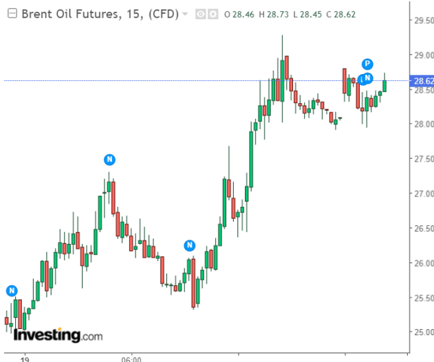
Chỉ báo kỹ thuật dầu Brent kỳ hạn tháng 05/2020