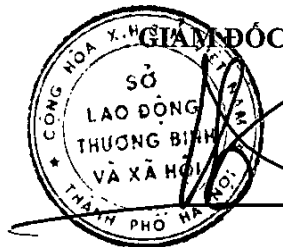
Bạch Liên Hương